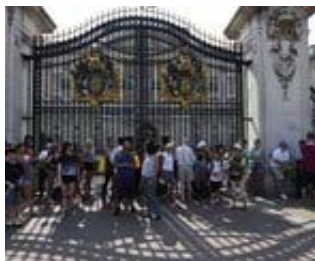
Nació el hijo del príncipe Guillermo y Catalina